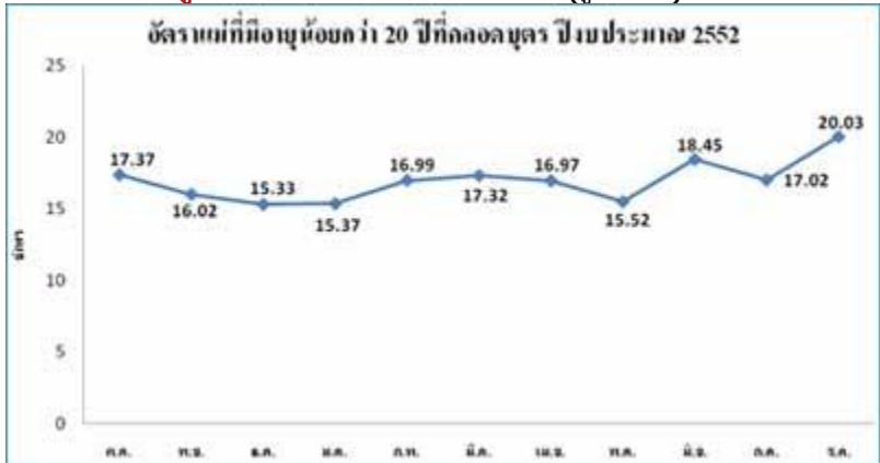
รูปที่ 3 อัตราแม่ที่มีอายุน้อยกว่า 20 ปีที่คลอดบุตรประจำปีงบประมาณ 2552

และในส่วนของปี 2552 นี้ ข้อมูลจากระบบรายงานเฉพาะกิจ โรงพยาบาลสายใยรักแห่งครอบครัว พบว่า อัตราแม่ที่มีอายุน้อยกว่า 20 ปีที่คลอดบุตรซึ่งแม้ว่าจะมีแนวโน้มลดลงในช่วงปลายปี 2551 แต่ก็กลับสูงขึ้นอีกตั้งแต่ต้นปี 2552 จนถึงปัจจุบัน (เดือนสิงหาคม) อีกทั้งยังมีแนวโน้มเพิ่มขึ้นสูงมากกว่าปีที่ผ่านมาด้วย(รูปที่ 3)